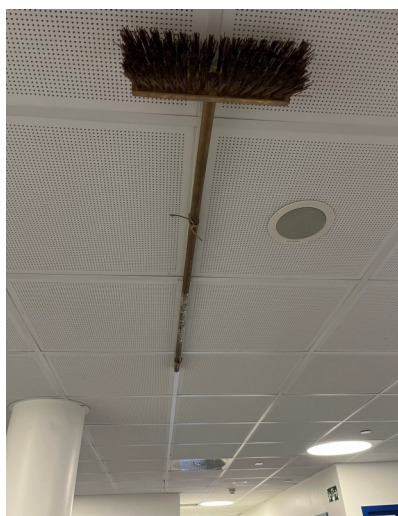
Gullkosten hengende i taket på 3. trinn—symbolet på godt arbeid

fotofinish kåret elevrådet 3. trinn til ukens vinnere. Så ryddige garderobes og fellesområder inspirerer.