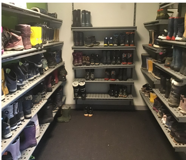
Elevene på 3. trinn viste eksemplarisk orden i uke 7

I den sjette konkurranseuken vant 3. trinn selve gullkosten! Etter drøftinger i jury og avgjort i