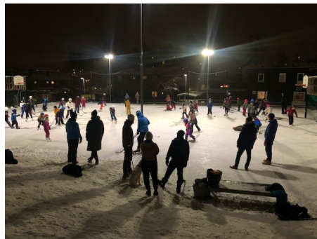
Herlig stemning på Munkisen en kald kveld i januar

Munkisen er åpen! Det vil si: trolig åpen fra onsdag etter mildværet forrige uke. FAU-gruppa som sprøyter og klargjør Munkisen gjør en fantastisk jobb, og gir oss som skole en veldig fin ekstraressurs på uteområdet. Isen blir brukt i kroppsøvingstimer, i friminutt og