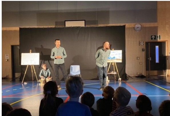
Afghanske trommer, fortelling og tegning i forestillingen Buzak Chini

Det var deilig å kjenne på litt kulturell stemning igjen, da Den kulturelle skolesekken gjestet Munkerud med den afghansk-norske forestillingen Buzak Chini. Endelig gjorde lyskastere, musikk og fortelling om gymsalen til en teaterscene igjen, og det var førstetrinn som fikk gleden av å oppleve DKS for første gang. Vi gleder oss til å komme tilbake til gult nivå, slik at andre elever også får oppleve DKS igjen!