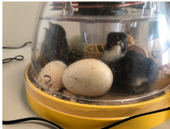
Tre små kyllinger venter på nye søsken

God morgen, verden! Spennende, motiverende og trivelig for ivrige små eggebønder på tredje trinn. Eggene og rugekassene kommer fra Søndre Ås gård, som Munkerud skole innledet et samarbeid med i 2019.